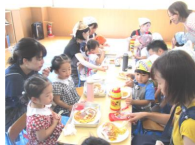
親子でクッキングをしたよ！