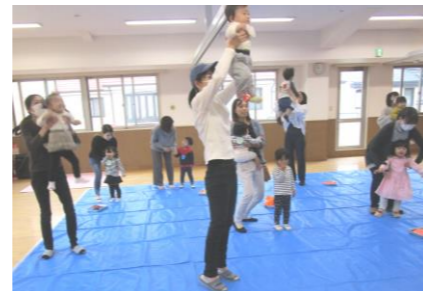
親子でふれあい体操をしたよ！