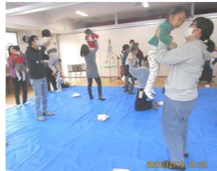
親子で体操をしたよ！