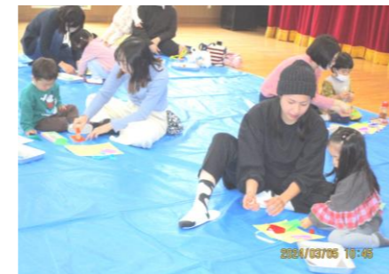
折り紙あそびも楽しかったです♪